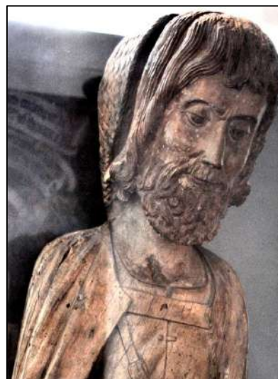
Saint Roch XV ème siècle Musée de l'Ancien Evêché Grenoble