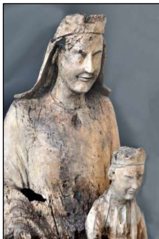
Vierge à l'enfant XII ème siècle Musée de l'Ancien Evêché Grenoble