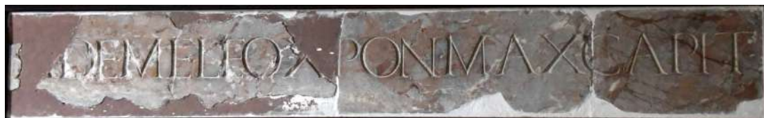
Fragments de la plaque scellée au linteau de la porte de la grande salle du château. Collection privée.

- AYMARDI DE MEDVLLIONE LEO X PONTIFEX MAXIMUS CAPITIS CONSTANTINI IMAGINEM DEDIT, A Aymard de Mévouillon Léon X le plus grand pontife a donné ces images de Constantin, traduit le roi à haute voix.