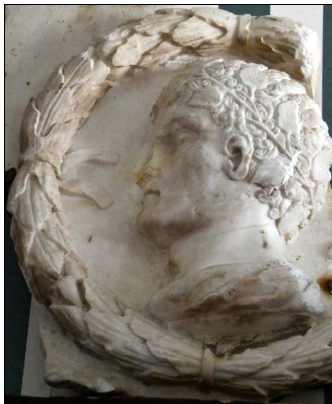
Ci-dessus le buste et un médaillon à l'effigie de Constantin I er d'après l'antique. Collection privée.