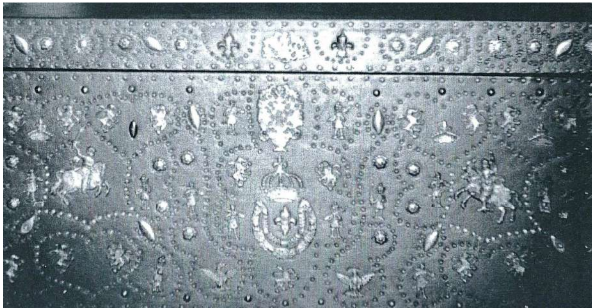
Coffre recouvert de cuir et comportant un ensemble de motifs entourés de clous formant des figures géométriques. On distingue également au centre une couronne royale surmontée d'une fleur de lys et dessous le collier de l'ordre de saint Michel entourant une autre fleur de lys. De part et d'autres sont représentés des personnages, des animaux et des cavaliers. Collection privée.

(Cliché vers 1970 et analyse de Raymond Moyroud)